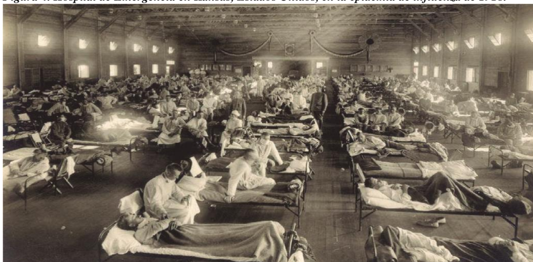
Figura 4. Hospital de Emergencia en Kansas, Estados Unidos, en la epidemia de influenza de 1918.

Era el final de la Primera Guerra Mundial. Los ejércitos involucrados en la contienda ocultaron la pandemia, ya que por lógicos motivos militares había censura en los medios de comunicación. En cambio, España, como país neutral, podía informar lo que acontecía.