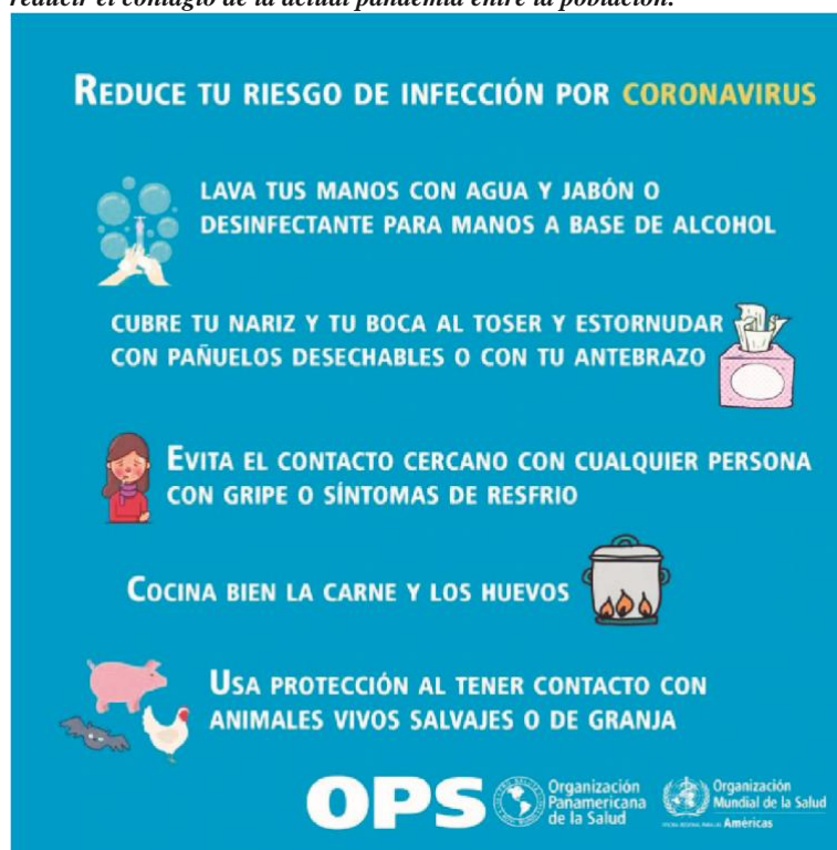
Figura 8. La OMS y la OPS han recomendado acciones sanitarias para controlar y reducir el contagio de la actual pandemia entre la población.

pandemia: a) se han cerrado fronteras, se han suspendido viajes aéreos y marítimos, así como viajes terrestres de larga distancia; b) se ha prohibido la presencia de personas en centros educativos, culturales, religiosos y de ocio; c) se han restringido las actividades comerciales e